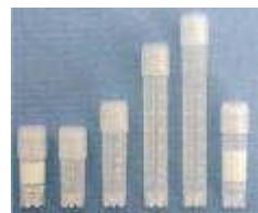
Röhren mit Stehrand

**Endotoxin-, Rnase-, Dnase frei, steril. (in Tabelle nur steril gekennzeichnet)